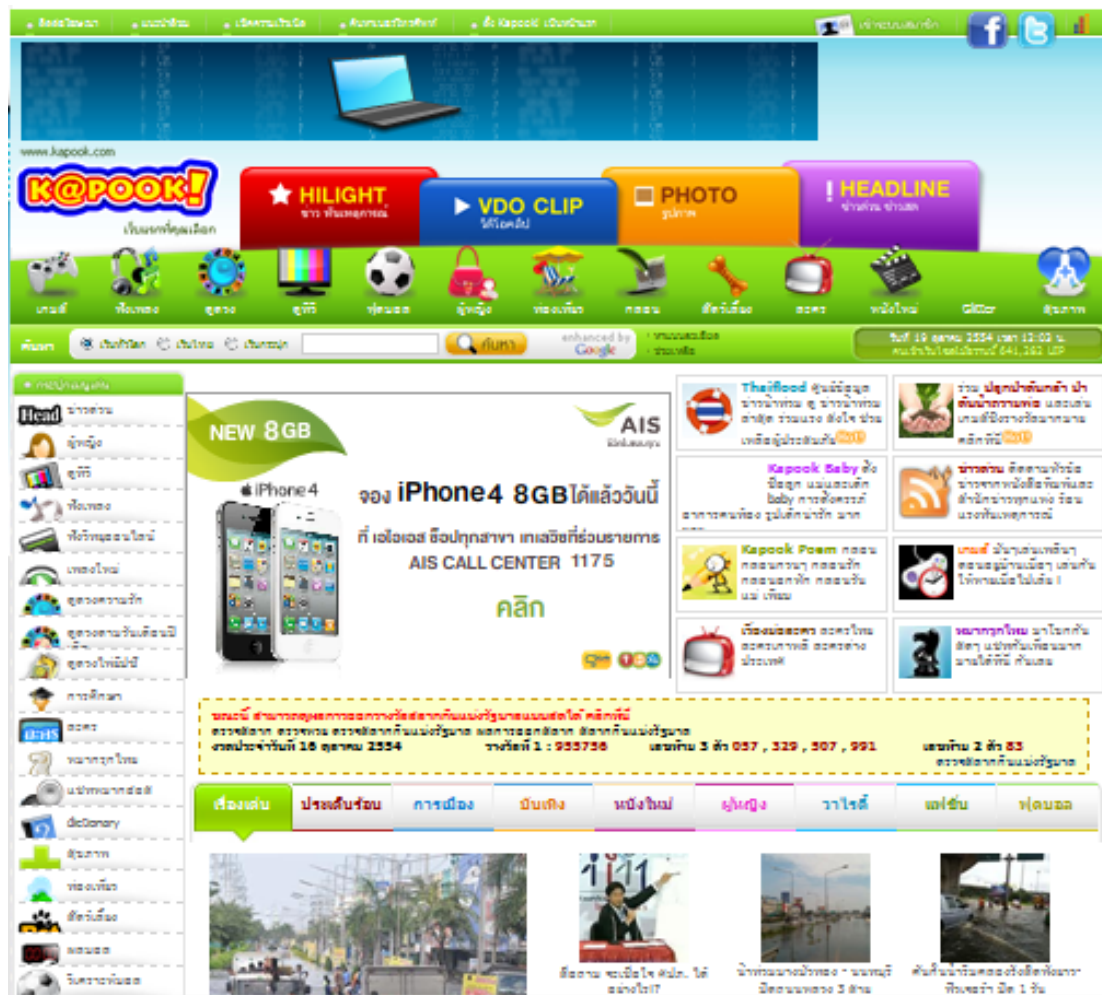
เว็บไซต์ www.kapook.com

โดยที่เว็บไซต์จะมีองค์ประกอบ คือ เว็บเพจ (Web Page) และ โฮมเพจ (Home Page) ซึ่งการสร้างเว็บไซต์สามารถสร้างได้ด้วย โปรแกรม Adobe Dreamweaver CS3