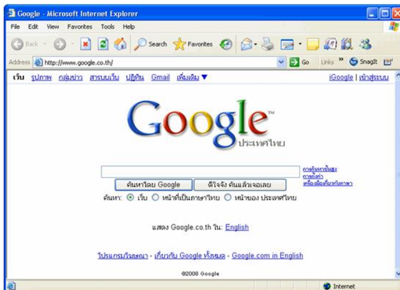
โฮมเพจ (Home Page) ของ www.Google.com

2. โฮมเพจ (Home Page) คือ หน้าแรกของเว็บไซต์ ถือเป็นหน้าที่สำคัญที่สุดของเว็บไซต์ จะมีความสวยงามเป็นพิเศษ เพื่อดึงดูดความสนใจของผู้เข้าชมเว็บไซต์ และมีข้อความที่เชื่อมโยง (Link) ต่อไปยังเว็บเพจอื่นได้อีก ซึ่งโฮมเพจ สามารถเชื่อมโยงกับเว็บเพจและเว็บไซต์อื่นๆอีกเป็นจำนวนมาก